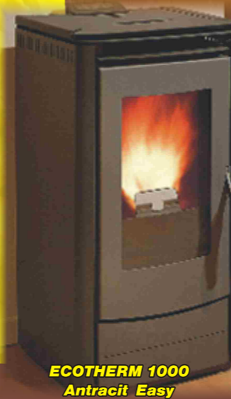
ECOTHERM 1000 Antracit Easy

Odkouření kamen průměr 80 mm s odťahovým ventilátorem - nenáročná na komínový tah. Vhodné i pro vytápění podkrovních bytů.