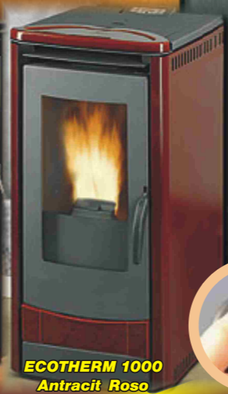
ECOTHERM 1000 Antracit Rosso